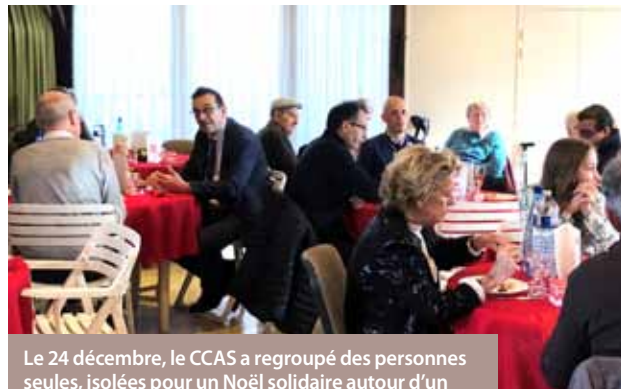
Le 24 décembre, le CCAS a regroupé des personnes seules, isolées pour un Noël solidaire autour d'un repas et d'une animation musicale.