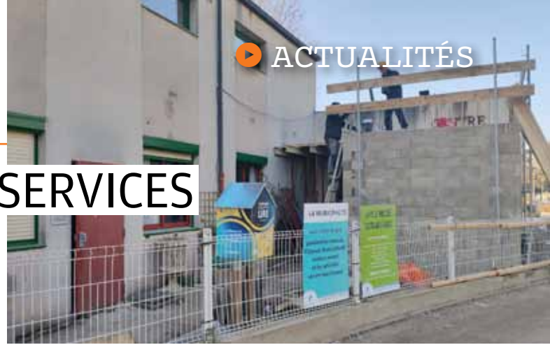
Durant les chantiers, certaines activités de l'Espace Socioculturel et de la petite enfance sont délocalisées. (voir pages 7 et 10)

D ans le cadre du regroupement des services au sein du centre municipal la Colline (lire page 7), les déménagements ont commencé. Depuis le 20 janvier, le service logement s'est installé avec l'Espace Socioculturel au 13 rue Rabelais. La Maison pour l'Emploi, les services politique de la ville et développement économique sont également désormais domiciliés au 13 rue Rabelais. Le Relais Santé va lui déménager à la fin du premier trimestre. Des travaux sont également en cours à la Bergamote.