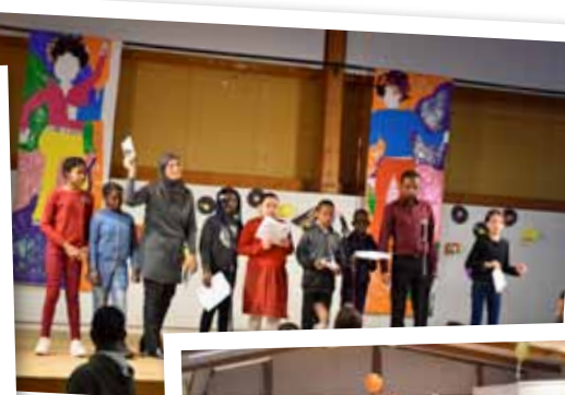
Flash back dans les années 80 pour le gala de Noël de l'Espace Socioculturel. Les invités ont profité des animations, un bon repas et une soirée dansante. Avec la participation des jeunes du service Jeunesse pour le service et de l'École Municipale de Football.