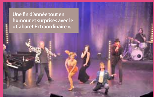
Une fin d'année tout en humour et surprises avec le « Cabaret Extraordinaire ».