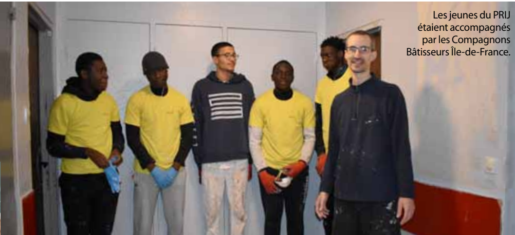
Les jeunes du PRIJ étaient accompagnés par les Compagnons Bâtitseurs Île-de-France.

À CHENNEVIÈRES, LE PRIJ ORIENTE ET LES JEUNES DE 16 À 25 ANS pour faciliter leur insertion sociale, citoyenne et professionnelle. Le chantier avec le bailleur social 1001 Vies Habitat et les Compagnons Bâtitseurs témoigne de la vitalité de cet accompagnement.