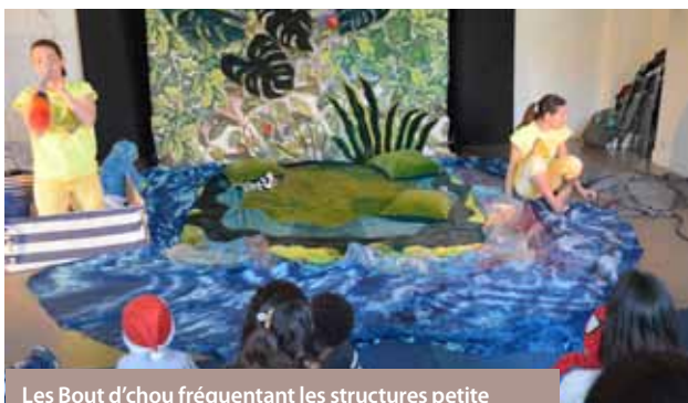
Les Bout d'chou fréquentant les structures petite enfance ont assisté au spectacle « Lave l'îlot » proposé par la compagnie La Petite Porte.