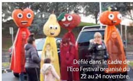
Défilé dans le cadre de l'Eco Festival organisé du 22 au 24 novembre.

Le programme des Robins des Bordes regorge d'activités à consulter et à actualiser sur leur site.