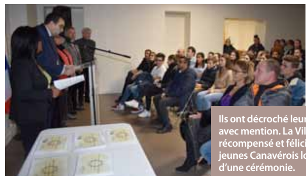
Ils ont décroché leur bac avec mention. La Ville a récompensé et félicité ces jeunes Canavérois lors d'une cérémonie.