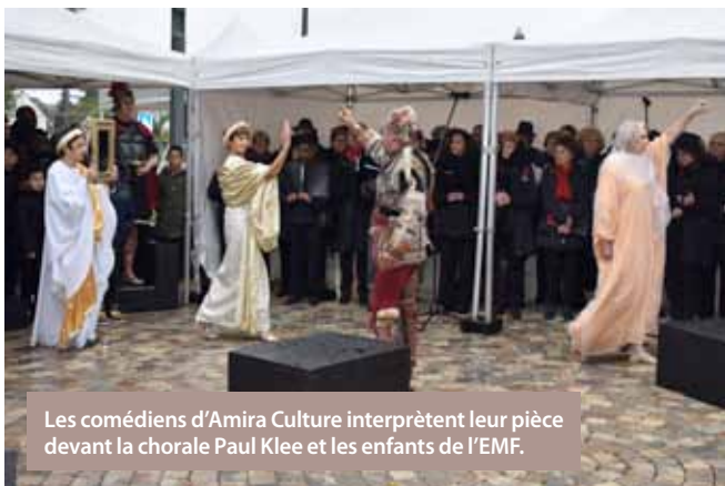
Les comédiens d'Amira Culture interprètent leur pièce devant la chorale Paul Klee et les enfants de l'EMF.

La Commémoration de l'Armistice et de tous les morts pour la France s'est déroulée devant le Monument pour la Paix. Le Conservatoire de musique Emile Vilain et les élèves de l'École Municipale de Football ont interprété « La Marseillaise ». Les comédiens d'Amira Culture ont ensuite présenté une pièce « Enfin la Paix », accompagnés par la chorale Paul Klee qui a chanté « La paix sur terre » de Jean Ferrat. La cérémonie s'est terminée par un lâcher de pigeons, des acteurs importants lors des conflits.