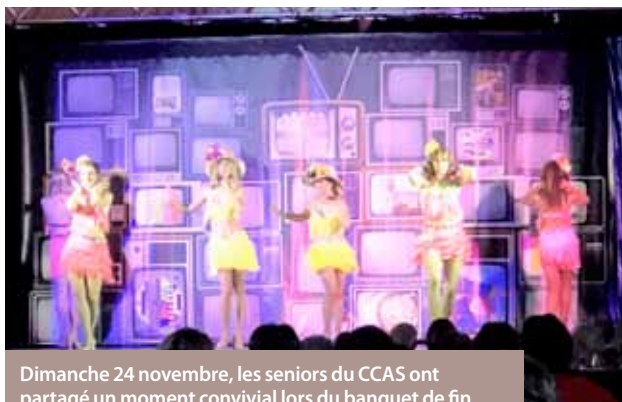
Dimanche 24 novembre, les seniors du CCAS ont partagé un moment convivial lors du banquet de fin d'année avec le spectacle « Nos idoles ».