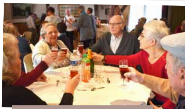
Mardi 17 décembre, goûter de Noël au Foyer de l'Age d'Or. Après avoir trinqué, les seniors ont chanté et dansé tout l'après-midi !