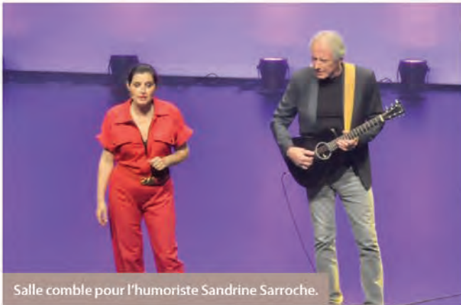
Salle comble pour l'humoriste Sandrine Sarroche.

La programmation de la nouvelle saison 2022/2023 vous sera dévoilée le dimanche 18 septembre à 16 h (voir page 24).