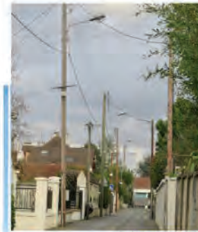
Chemin du Splendid Panorama avant.

Les travaux de réaménagement de voirie se poursuivent rue Aristide Briand et chemin du Splendid Panorama. Après l'enfouissement des réseaux, les nouveaux candélabres ont été installés dans le cadre du marché à performance énergétique.