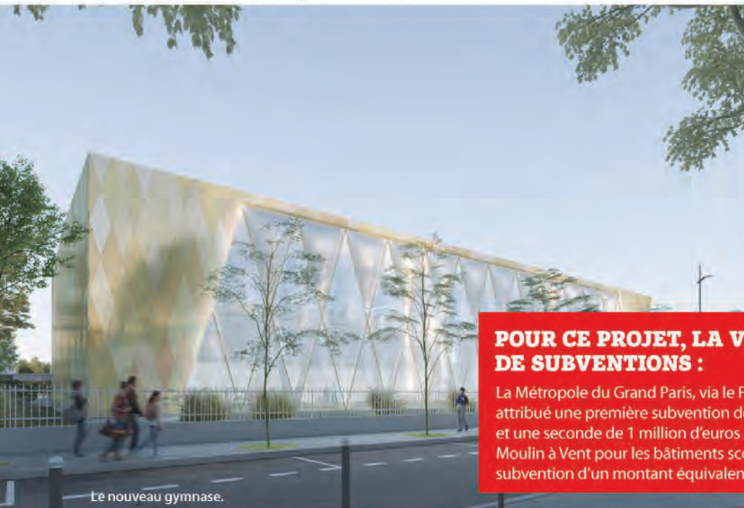
Le nouveau gymnase.

leur salle de réunion déplacée au sein de la loge du gardien.