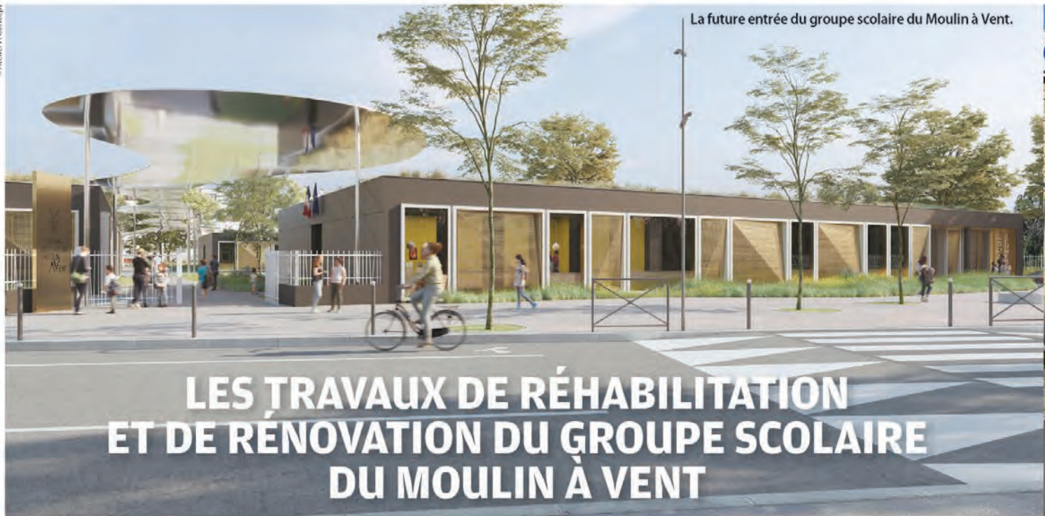
La future entrée du groupe scolaire du Moulin à Vent.