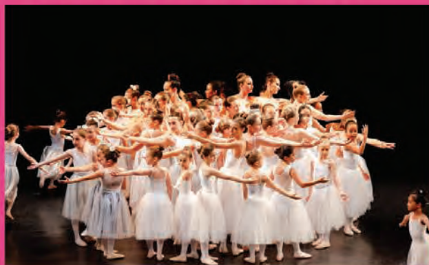
Spectacle de fin d'année des élèves des cours de danse classique et contemporaine du conservatoire de danse Emile Vilain, mis en scène par leur professeur Sandrine Cassin.