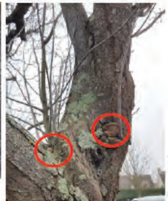
Rue Descartes - prunier RD 37 : branches colonisées par Phellinus pomaceus .

dépérissement. Certains considérés comme dangereux ont déjà été abattus.