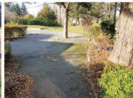
Buttes du Bois l'Abbé - platane BBA 66 : école maternelle Clément Ader - cyprès EMCA 34 : dégâts racinaires importants sur le revêtement des allées.

les tilleuls ouvrent la porte aux parasites et autres agents lignivores. Elles sont dues à un mauvais usage des griffes d'élagueur, désormais interdites sauf en cas d'abattage. D'autres blessures comprennent les entailles causées en bas des troncs sur certains arbres par les chocs de voitures stationnées, les lames de tondeuses à gazon ou débroussaillieuses. Par ailleurs, ces revêtements étouffent les racines des arbres et limitent l'accès à l'eau dont les végétaux ont besoin : ce qui est le cas dans les cours de récréation des écoles et dans les rues de Chennevières. En parallèle, les têtes de chat, des excroissances dues aux élagages réguliers, doivent être surveillées : leur poids peut provoquer de nombreux rejets pouvant entraîner des arrachements ou la chute d'une grosse branche... Un piéton qui passe sous ces branches emmêlées, peut par exemple, être gravement blessé. Une telle chute engage la responsabilité civile, voire pénale des décideurs de la ville. Aussi, cette étude rappelle que les racines des arbres peuvent causer des dégâts sur les revêtements en bitume des trottoirs et des cours de récréation et provoquent des accidents en engageant la responsabilité de la ville.