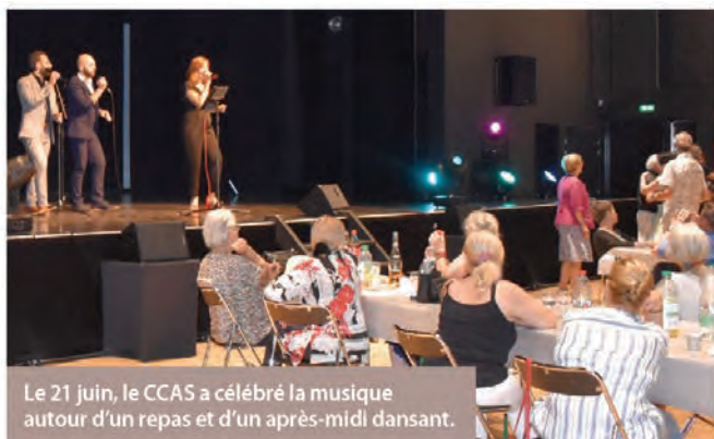
Le 21 juin, le CCAS a célébré la musique autour d'un repas et d'un après-midi dansant.