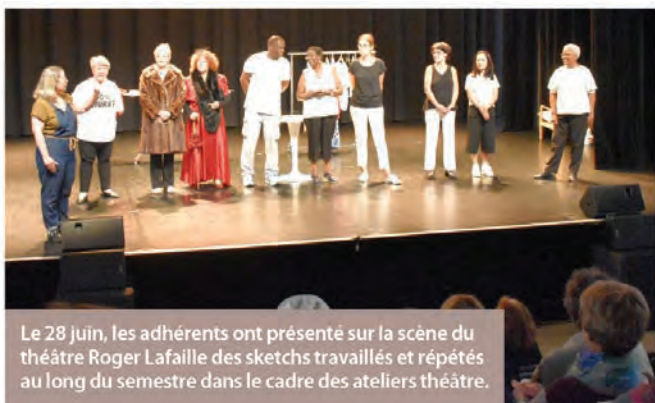
Le 28 juin, les adhérents ont présenté sur la scène du théâtre Roger Lafaille des sketches travaillés et répétés au long du semestre dans le cadre des ateliers théâtre.