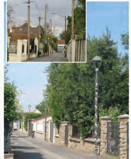
Chemin du Splendid Panorama après.