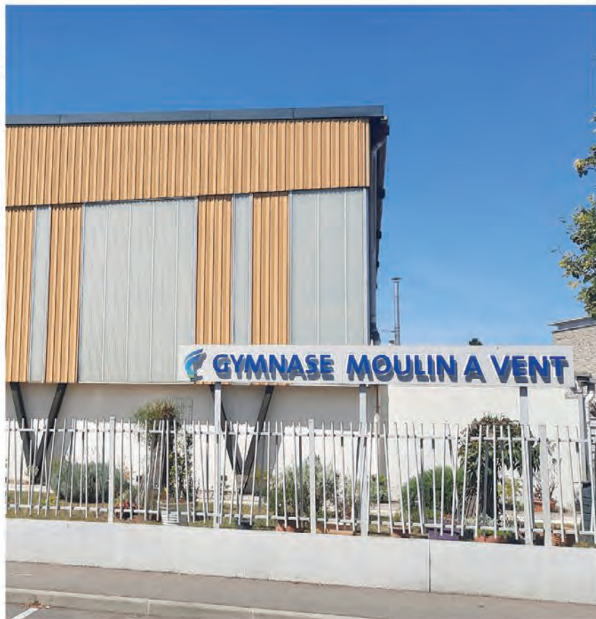
Le gymnase aujourd'hui.