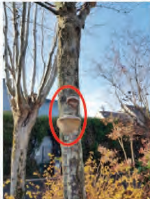
Rue Fragonard - pruniers RF 67 et RF 86 : fructifications du champignon Phellinus pomaceus sur, respectivement, tronc et branches.