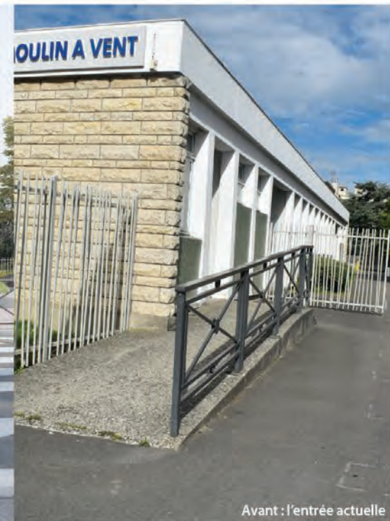
Avant : l'entrée actuelle