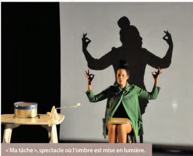
« Ma tâche », spectacle où l'ombre est mise en lumière.