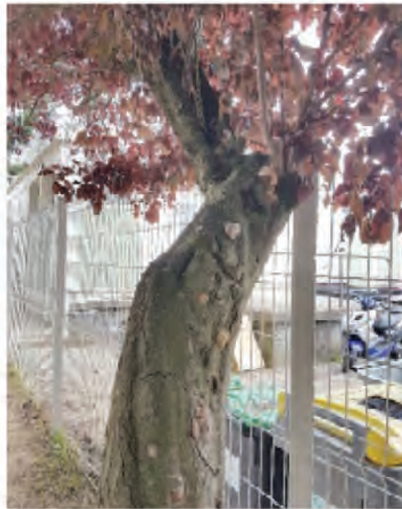
École du Moulin à Vent - prunier EMV 30 : fructifications du champignon Phellinus pomaceus sur le tronc.

Le patrimoine arboré de Chennevières se compose de 1834 sujets répartis en 60 genres et 83 espèces. Cinq espèces représentent 40% de cet ensemble. Les 153 érables sycomores et les 152 robiniers faux-acacias sont les essences majoritaires, représentant chacune 8% des arbres de la plantation. Principalement représentées au Fort de Champigny, ces espèces, constituées de boisements, réunissent à elles seules 27% du patrimoine sylvicole de la ville. En dehors du Fort de Champigny, les 145 frênes communs, les 144 érables planes et les 144 marronniers d'Inde sont les espèces principales des plantations de la ville. Comme le démontre cette étude, environ 80 arbres, des buttes du Bois l'Abbé, à la rue Claude Bernard en passant par le quartier « Mon Idée » et la rue du Belvédère sont considérés comme morts ou atteints de maladies ou présentent des plaies révélatrices de symptômes de