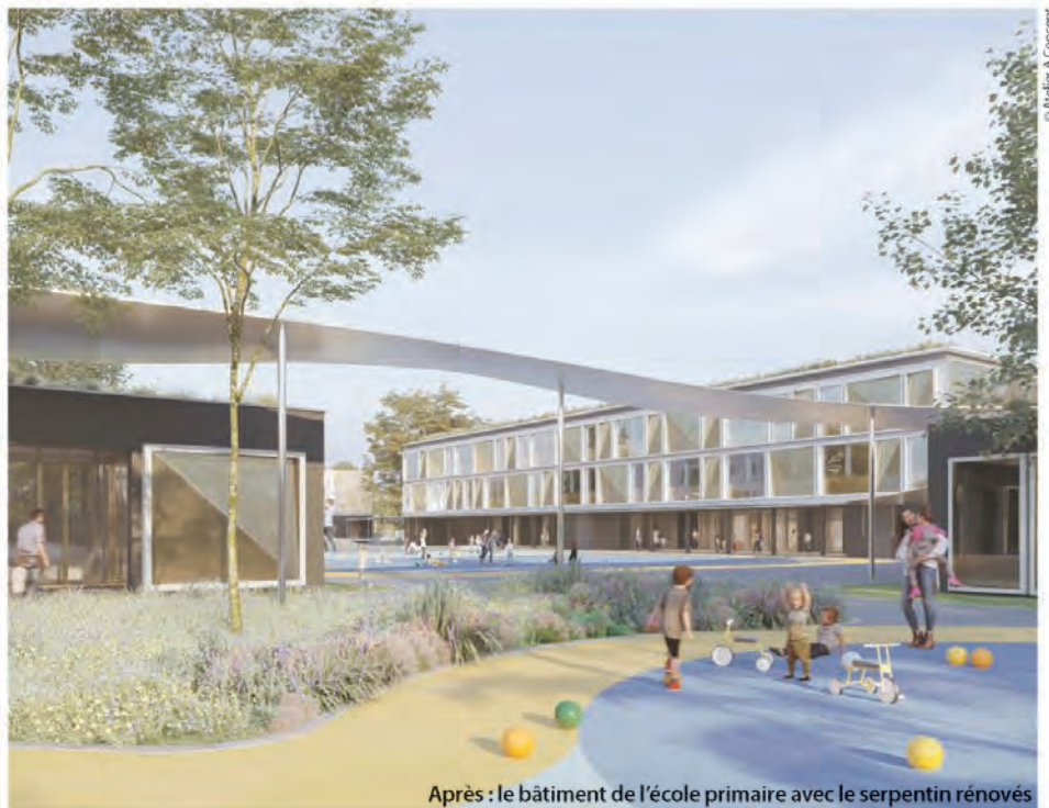
Après : le bâtiment de l'école primaire avec le serpentin rénovés