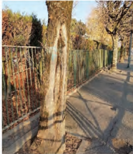
Place Mon idée - tilleul PMI 36 ; rue des Bordes - tilleul RB 36 : plaies de brûlure solaire sur le tronc. L'une est creuse, la seconde est en cours de dégradation.

fructifications du champignon « Phellinus pomaceus » qui dégradent les parties de soutien de l'arbre sous forme de pourritures blanches, détruisant les tissus conducteurs de la sève. Par ailleurs, un thuya des Buttes du Bois l'Abbé est touché par le « chancre corticola du cyprès » provoqué par un autre champignon qui détruit et s'insinue dans son écorce, entraînant le dépérissement de l'arbre. Certains marronniers, quant à eux, sont touchés par la « mineuse du marronnier », papillon venant des Balkans et repéré en Île-de-France depuis 2001, dont la chenille destructrice ravage rameaux et feuillages. L'espèce la plus touchée est le marronnier d'Inde à feuilles blanches, alors que le marronnier à fleurs rouges, ne donnant pas de fruits, est peu attaqué. Dernier ravageur à surveiller, le « bupreste du genévrier », apparu avec les années 2000 s'attaque aux thuyas et faux cyprès. Enfin, les arbres peuvent attraper des coups de soleil : ce qui est le cas de certaines espèces qui présentent une nécrose de l'aubier liée à une exposition brutale à la lumière.