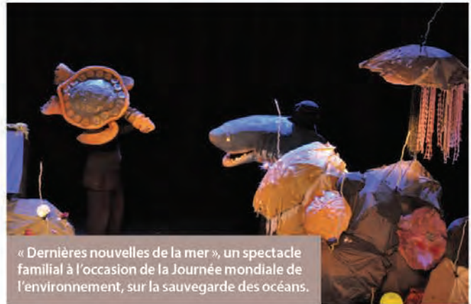
« Dernières nouvelles de la mer », un spectacle familial à l'occasion de la Journée mondiale de l'environnement, sur la sauvegarde des océans.