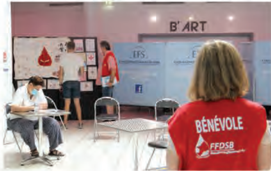
Les bénévoles de l'association lors d'une collecte de don de sang à Ormesson, le 9 juillet dernier.

D epuis sa création en 2019, l'Association intercommunale pour le Don de Sang Bénévole du Plateau de la Brie (ADSB) promeut le don de sang à travers des actions de sensibilisation et des campagnes d'information, tout en apportant un soutien administratif et logistique à l'Établissement Français du Sang (EFS) lors des collectes.