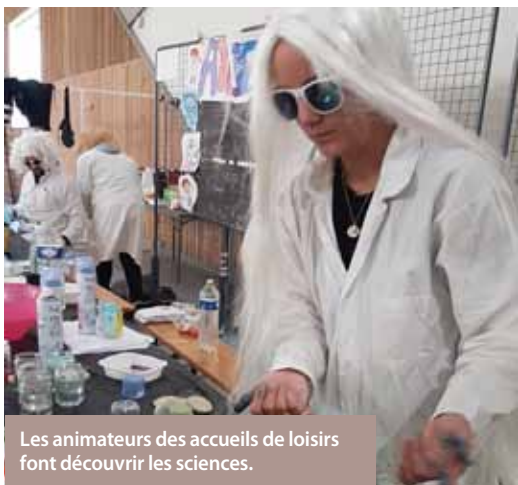
Les animateurs des accueils de loisirs font découvrir les sciences.

Grande réussite pour cette première édition organisée par les services Enfance, Jeunesse et la Maison bleue pour la petite enfance. A travers de nombreuses animations, l'objectif était de présenter les activités proposées pour les enfants et les jeunes dans les différentes structures de la ville.