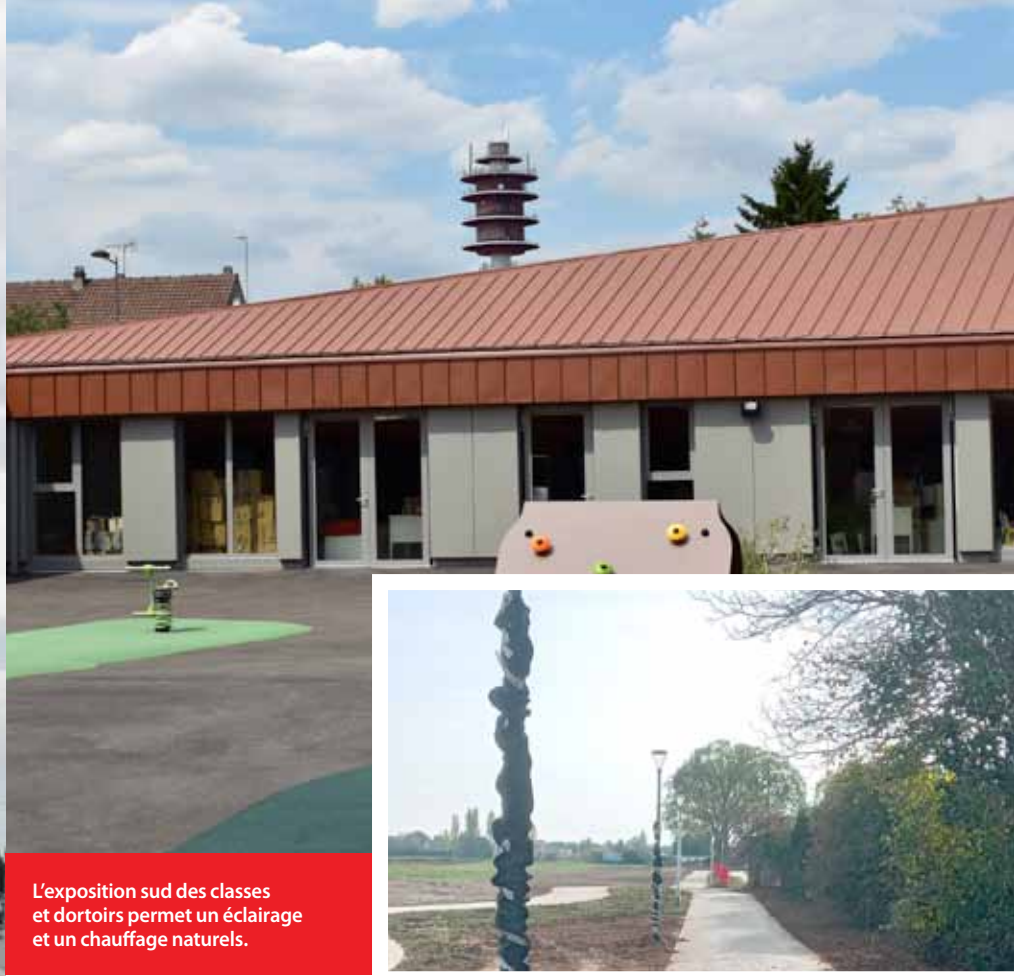
L'exposition sud des classes et dortoirs permet un éclairage et un chauffage naturels.