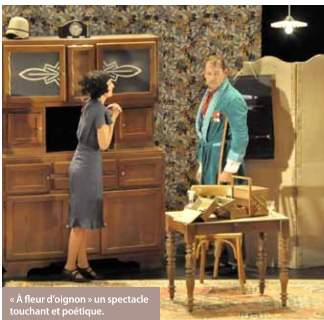
« À fleur d'oignon » un spectacle touchant et poétique.