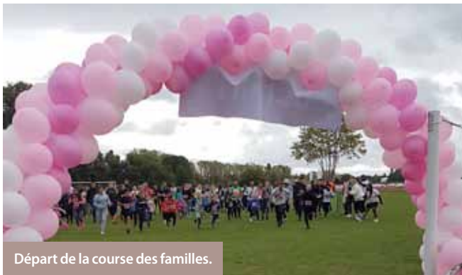
Départ de la course des familles.