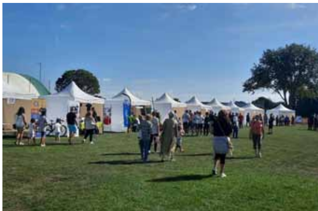
Dimanche 4 septembre, les associations canavéroises sont venues présenter leurs activités.