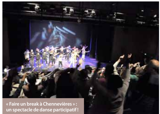
« Faire un break à Chennevières » : un spectacle de danse participatif !

Dimanche 18 septembre : lancement de la saison du Théâtre Roger Lafaille. Une saison diversifiée avec du théâtre, des concerts, de la danse, portée vers la réflexion, le rêve et le plaisir !