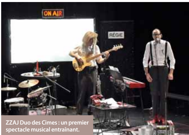
ZZAJ Duo des Cimes : un premier spectacle musical entraînant.

Dimanche 18 septembre : lancement de la saison du Théâtre Roger Lafaille. Une saison diversifiée avec du théâtre, des concerts, de la danse, portée vers la réflexion, le rêve et le plaisir !