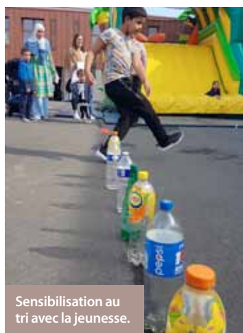
Sensibilisation au tri avec la jeunesse.