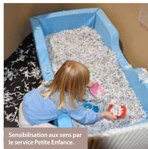
Sensibilisation aux sens par le service Petite Enfance.