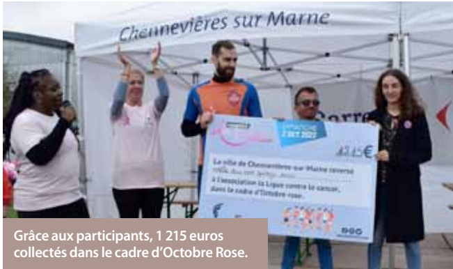
Grâce aux participants, 1 215 euros collectés dans le cadre d'Octobre Rose.

303 participants et 1 215 euros reversés à la Ligue contre le cancer dans le cadre d'Octobre rose. Bilan positif pour ces premières foulées canavéroises qui se sont déroulées le dimanche 2 octobre avec 3 courses : 8 km, 4 km et la course des familles. Merci aux partenaires Fitness Park, Carrefour et Healthy Vibes. À vos baskets et entraînez-vous pour la 2 e édition en 2023 !