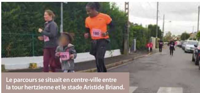
Le parcours se situait en centre-ville entre la tour hertzienne et le stade Aristide Briand.