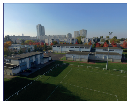
Le stade Armand Fey