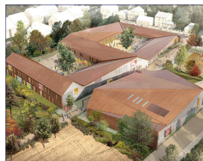
Le groupe scolaire Germaine Tillion