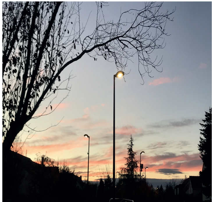
Le marché à performance énergétique a pour objectif de réaliser des économies grâce au renouvellement de l'éclairage public.